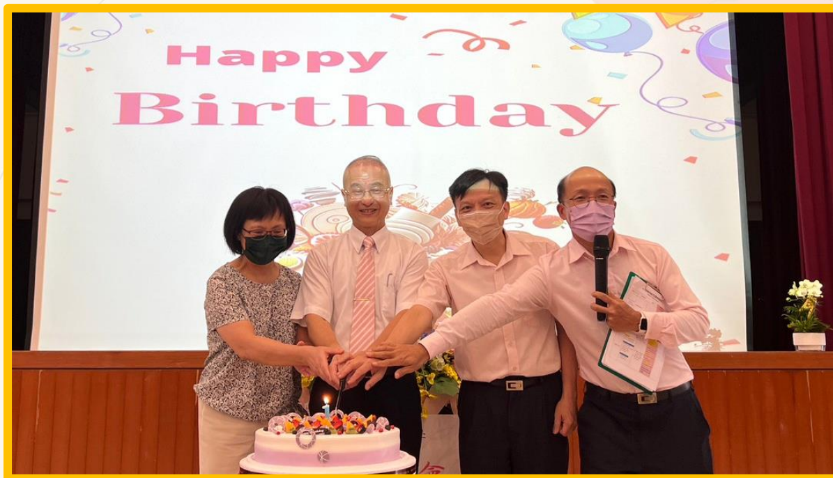
【2023 年 6 月 7 日 慶生活動】