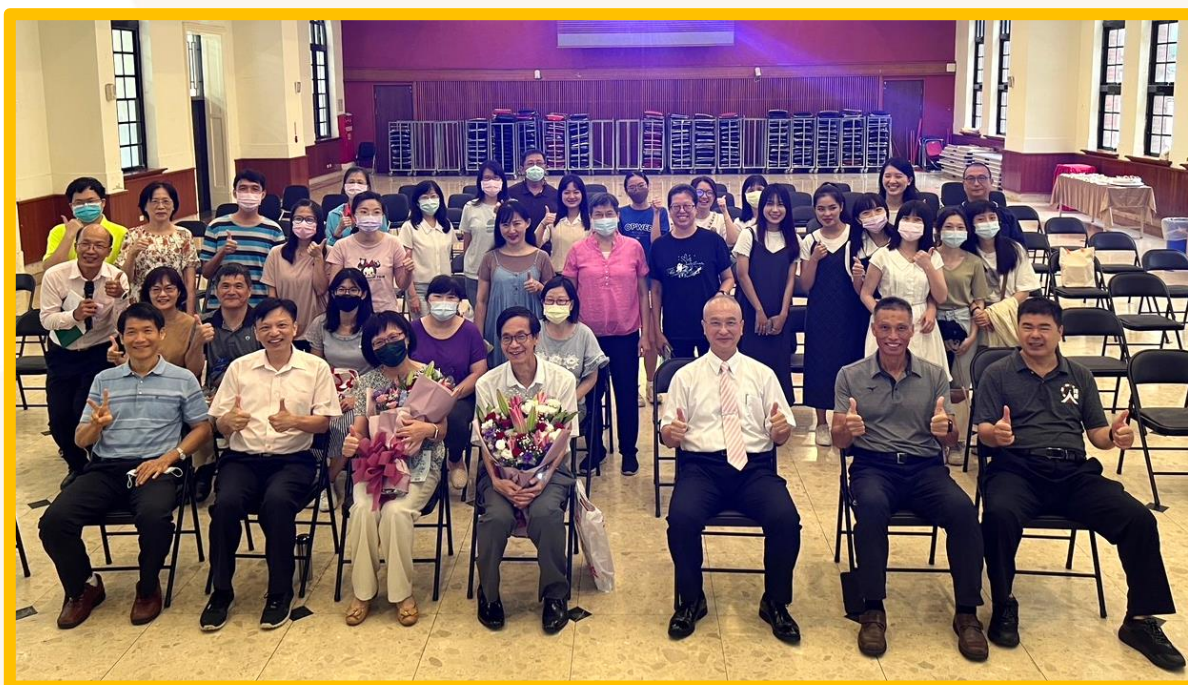
【2023 年 6 月 7 日 退休茶會】